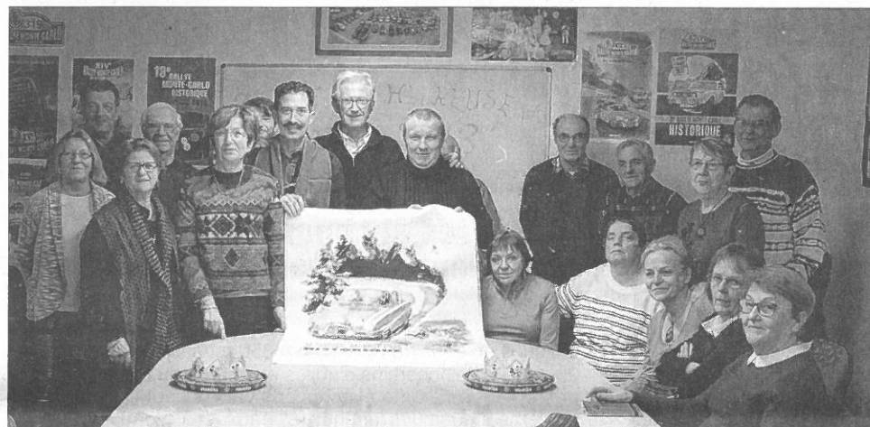
L'équipe du comité des fêtes est fin prête à accueillir les voitures du rallye sur le quai Farconnet.

route des Crêtes sera fermée à toute circulation de 12 à 22 h. À l'arrivée en ville par le rond-point de l'Octroi, les voitures s'engageront sur le quai à hauteur du club 7 et du Bistingo. Comme d'habitude, le public pourra admirer les véhicules et les assistances sur le parc fermé réservé au rallye et profiter des stands du comité des fêtes proposant divers souvenirs du rallye (plaques, affiches, écharpes, casquettes, ...), ainsi que des boissons chaudes et des gourmandises. Le comité des fêtes présentera également le gros lot de la tombola de la balade en Saint-Joseph 2018 : une superbe Renault 5 de 1981, équipée d'un moteur de 845 cm 3 et 65 000 km d'origine au compteur. Les billets seront en vente sur place à 4 € l'unité, une affaire pour une voiture de collection comme toutes celles que l'on pourra voir sur le quai Farconnet le 4 février.